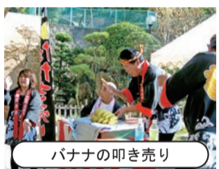
バナナの叩き売り