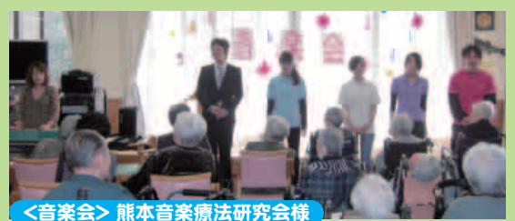
＜音楽会＞ 熊本音楽療法研究会様