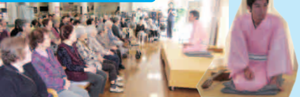
文化週間に参加いただきました