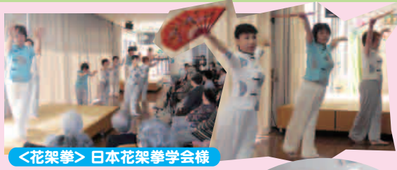
＜花架拳＞ 日本花架拳学会様