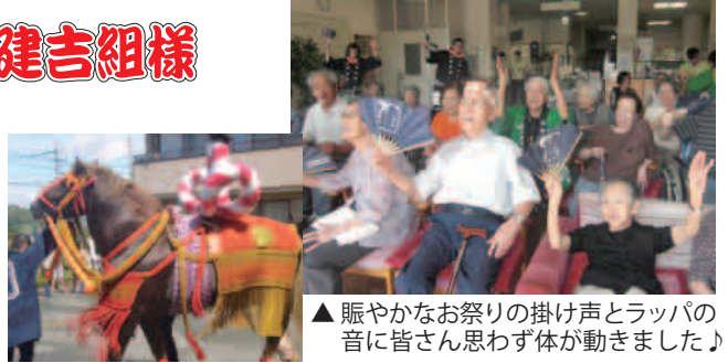
▲賑やかなお祭りの掛け声とラッパの音に皆さん思わず体が動きました♪