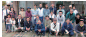
▲清掃ボランティア<建吉組様>