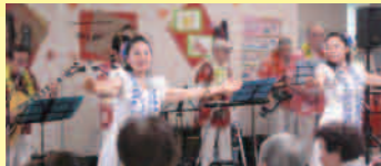
サン&ブルーオーシャン様