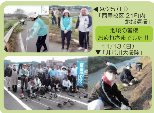
◀ 9/25(日) 「西里校区 21町内 地域清掃」 地域の皆様 お疲れさまでした!! 11/13(日) ▼ 「井芹川大掃除」

どちらも、地域の方と楽しく語らい、また地域の色々な情報を教えていただきながら清掃活動に取り組んできました。微力ではありますが、草刈りやごみ拾いにより、地域がきれいになるのは気持ちがいいものです。今後も地域社会の一員として、参加していきたいと思えます。（地域支援室 本多）